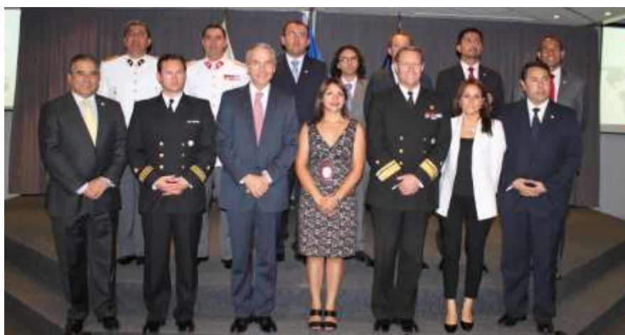
Nuevos Magíster en Ciencias Políticas, Seguridad y Defensa