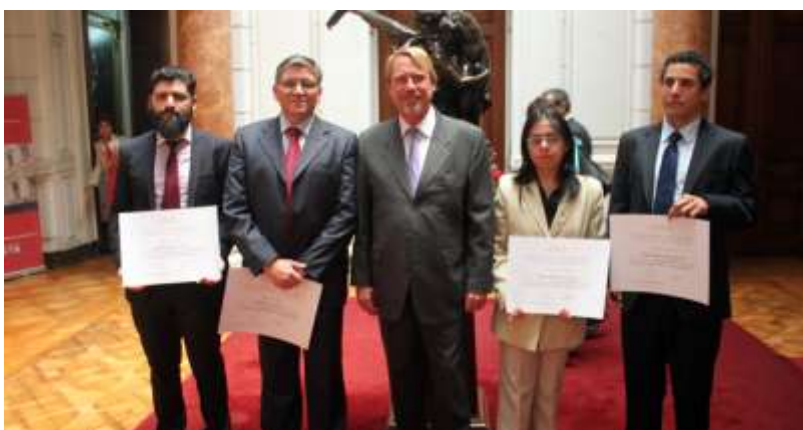
Los ganadores y menciones honoríficas del concurso